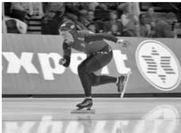
Foto. De schaats van het standbeen glijdt evenwijdig aan de lijn op het ijs, de linker bil hangt links van de glij-schaats, echt overkomen dus (Chris Witty).

wicht recht boven de schaats komt, kun je goed rechttuit glijden.